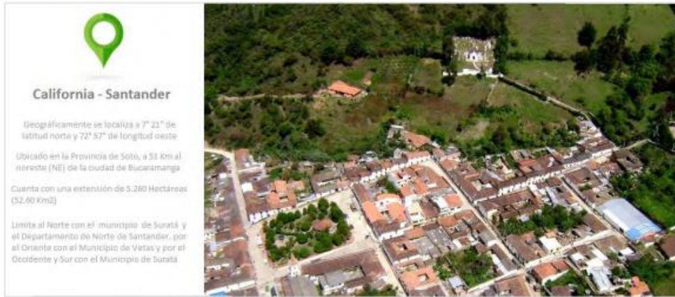
Ilustración 1. Caracterización territorial